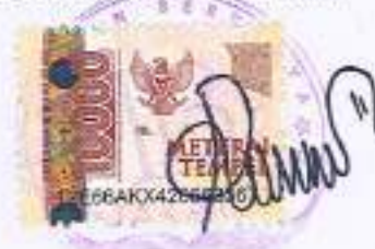
HERY WIJAYA DIREKTUR