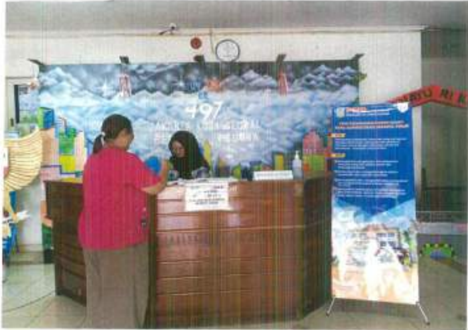
Gambar 1 : Ruang Pelayanan