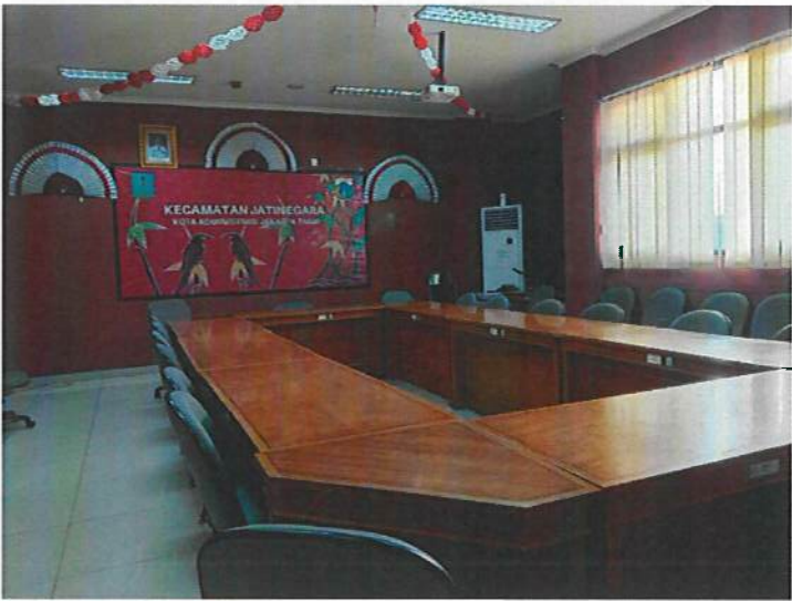
Ruang Rapat PPID