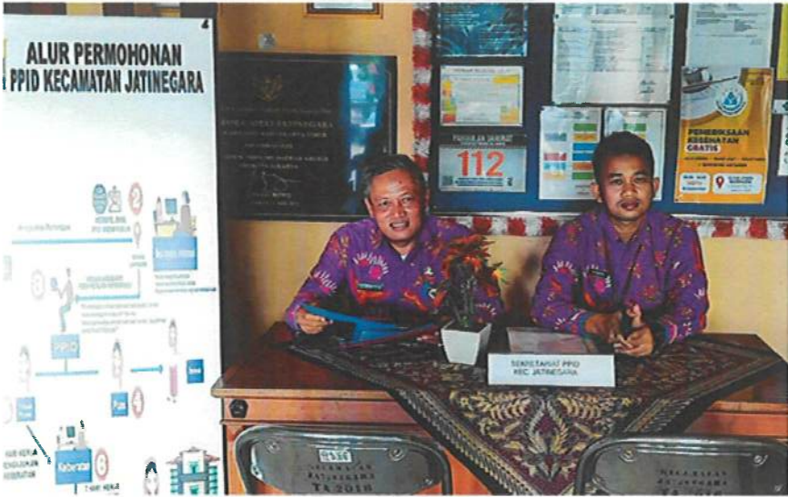
Ruang Piket Pelayanan PPID