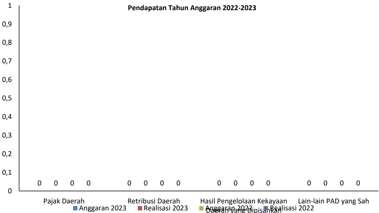
Grafik Perbandingan Realisasi Pendapatan TA 2022-2023

Pencapaian target Pendapatan Hasil Pengelolaan Kekayaan Daerah sebesar Rp 0 mengalami kenaikan/penurunan sebesar Rp 0 dibandingkan tahun lalu. Kenaikan realisasi pajak terjadi diantaranya karena ada .....